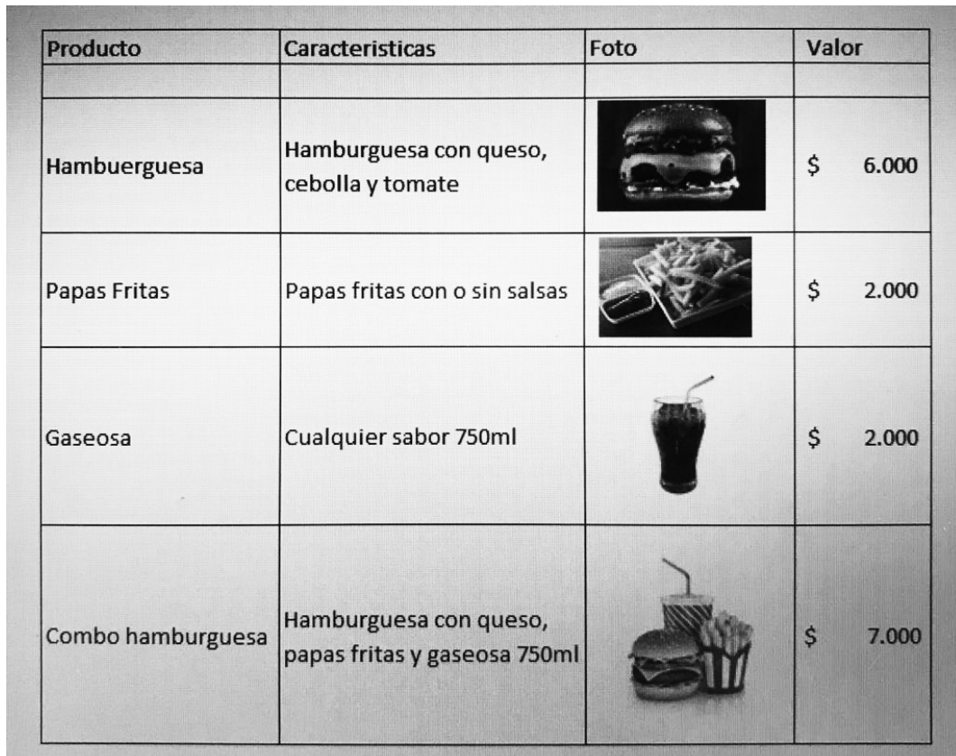
Ejemplo en forma digital

En lo posible utilizar el programa de Microsoft Excel (u otra herramienta como Word) para la realización de la base de datos, en una hoja de cálculo el listado de los productos y en la otra el listado de los clientes.